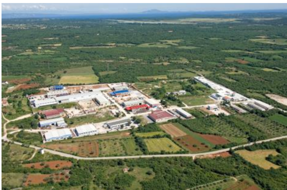
Slika 1. Zona male privrede „Galižana“

Poslovna zona Vodnjan sjever površine je 400.000 m 2 u kojoj posluje nekoliko tvrtki, jedna veća tvrtka za obradu metala, te nekoliko manjih tvrtki. Zona je pretežito namijenjena za industrijske i zanatske djelatnosti, infrastrukturno je opremljena, uskoro se očekuje dovršetak radova na gradnji plinovoda kojim će se u zonu dovesti prirodni zemni plin. Završena je gradnja velikog kružnog toka te zona ima direktan pristup s glavne prometnice tj. autoputa Istarski Y.