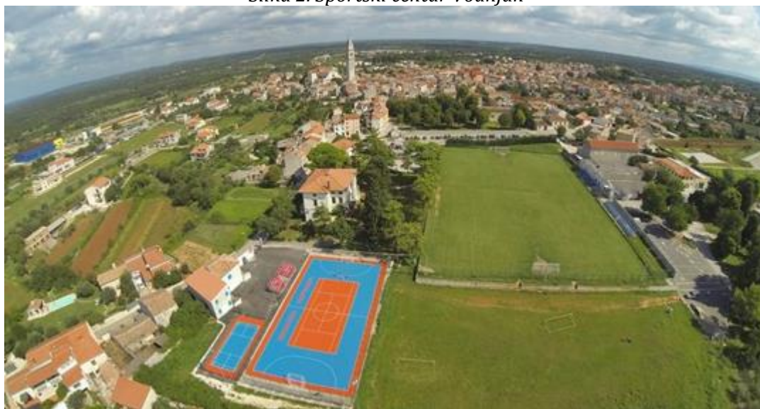
Slika 2. Sportski centar Vodnjan

Grad Vodnjan-Dignano postupio je prema preporukama Državnog ureda za reviziju i popisao nogometna igrališta te ista upisao u Evidenciju imovine Grada Vodnjana-Dignano koja se nalazi na stranici Grada.